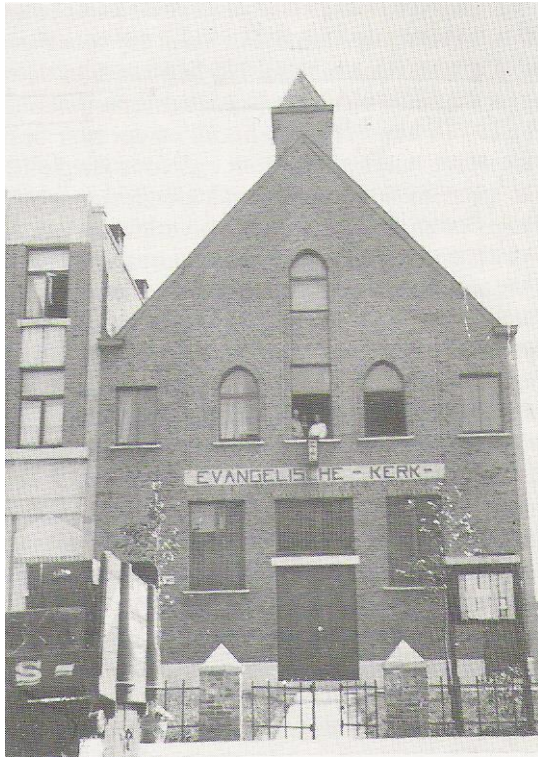
de eerste Pinksterkerk van België in Hoboken. Het gebouw is nog steeds in functie;

Het Verbond Van Pinkstergemeenten had in 2007 ongeveer 6500 leden en 89 aangesloten kerken.